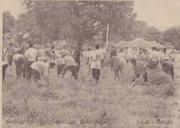
கிளிநொச்சி மாவீரர் துயிலுமில்லத்தில்...

நேற்று கிளிநொச்சி நகர வர்த்தக சங்கத்தின் ஏற்பாட்டில் கிளிநொச்சி