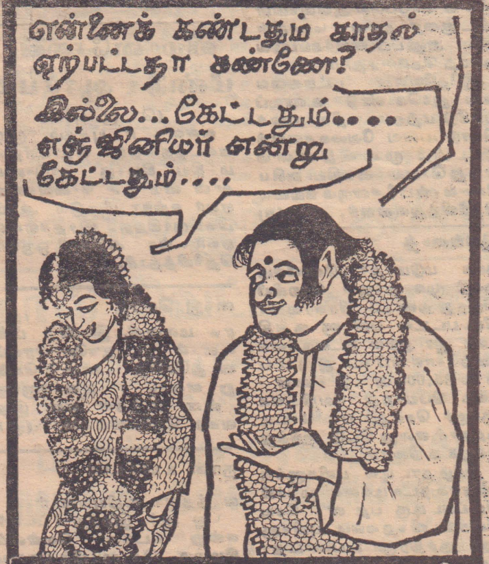
காது நிறைந்த கணவன்

துன்புற்ற மனிதர்கள் தோன்றினார்கள். அப்போது தான் ஜீவத்துடிப்பும், சுதந்திர உணர்வும் மிக்க சமுதாயம் தோன்றும் பெறும். இதற்கெதிரான சக்தி மிக்க தடைகளில் ஒன்றாக சீதனமும் அமைந்துள்ளது என்பதை நாம் என்றும் நினைவில் கொள்வோமாக.