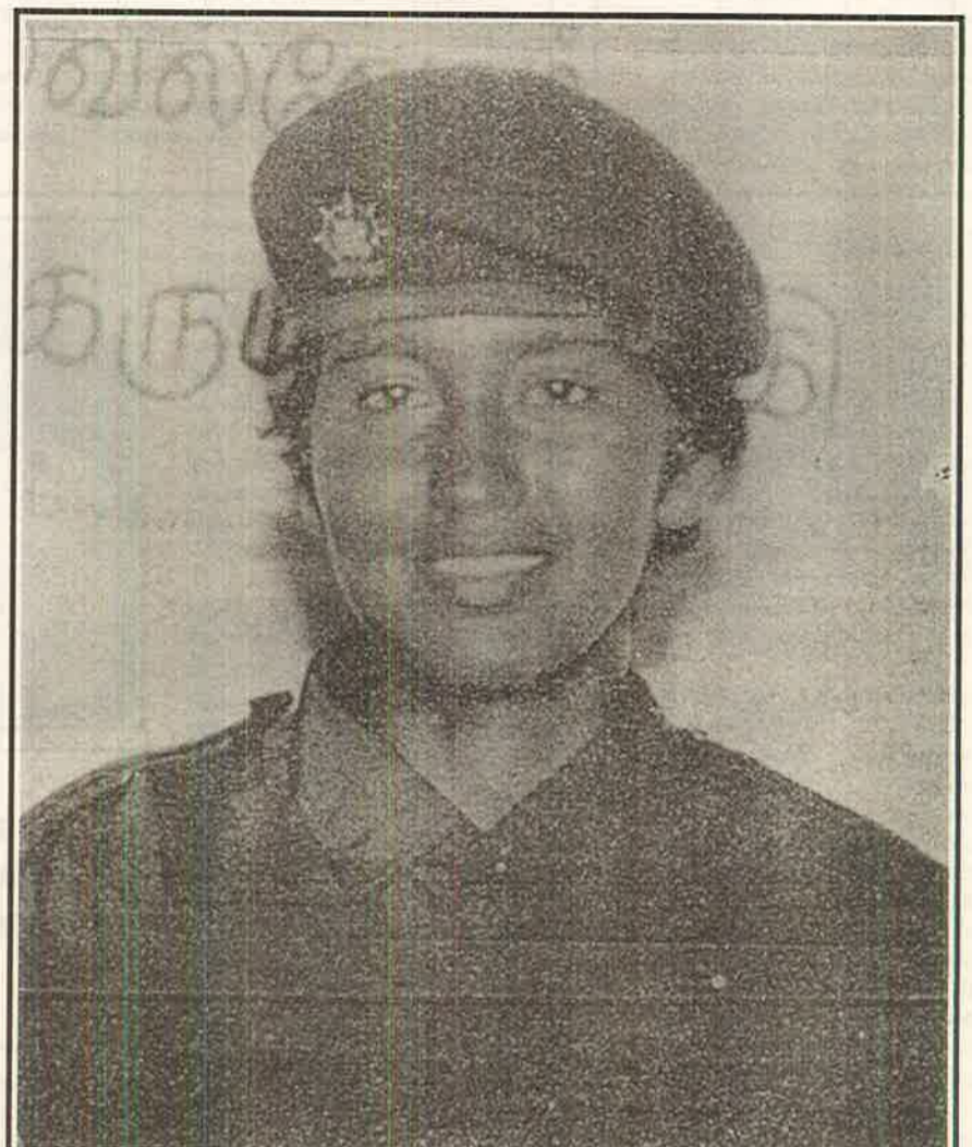
பெண் கடற் கரும்புலி மேஜர் மங்கை மிருசவில்