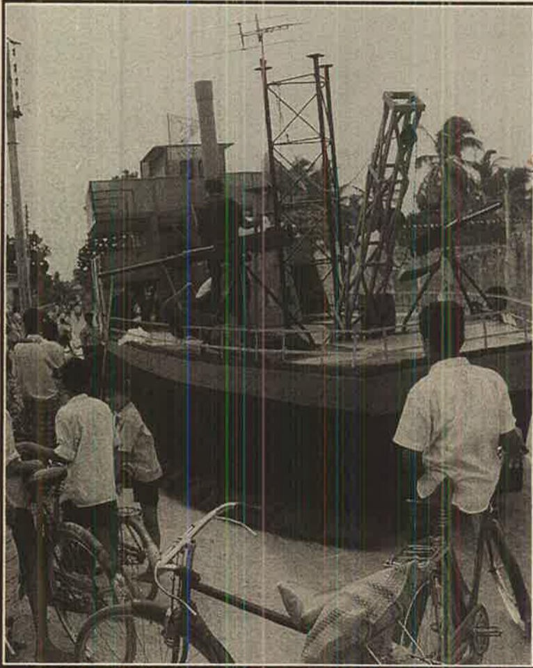
கடற்கரும்புலி கப்டன் அங்கயற்கண்ணி தாக்கி அழித்த, சிறீலங்கா கடற்படைக்குச் சொந்தமான தாய்க் கப்பலின் மாதிரித் தோற்றம் மக்கள் பார்வைக்காக...