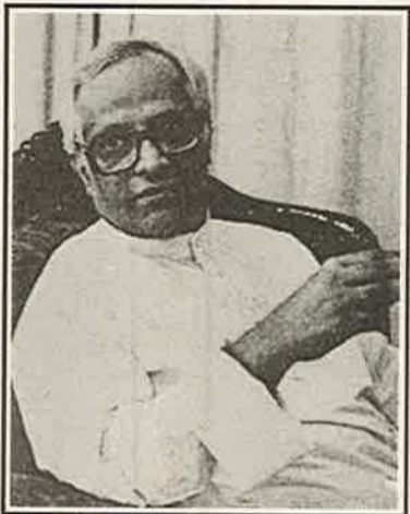
யிலான உறவும் இருந்தாலும், ஐயுறுவதும் இருக்கத்தான் செய்யும்."

"நிச்சயமாக, ஜனாதிபதி ஜெயவர்த்தனா சந்தேகத்திற்கு அப்பாற்பட்ட வகையில், ஒப்பந்தம்,