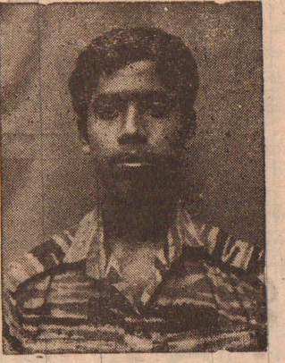
கட்டைக்காடு நேரடி மோதலில் வீரச்சாவைத் தழுவிய மாவீரன்