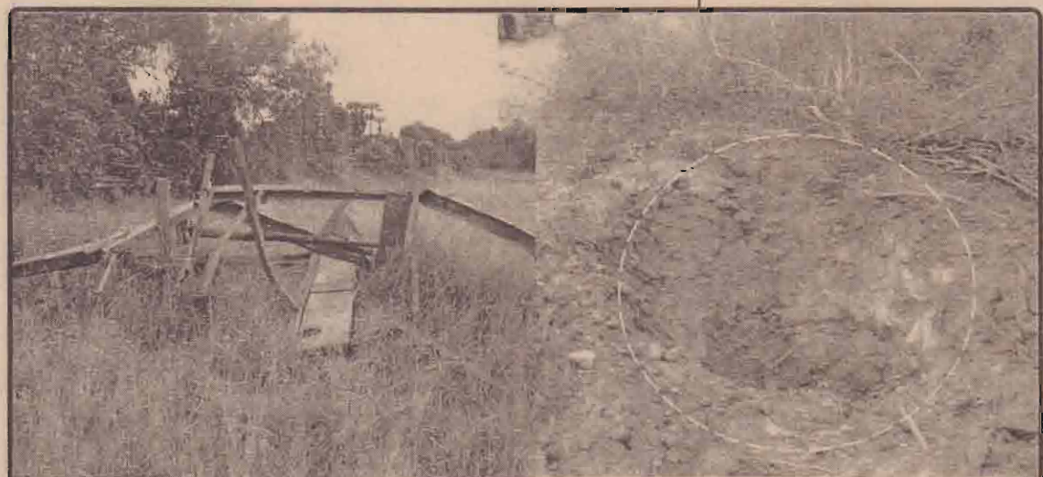
கிளிநொச்சி பரந்தன் பிறவுன் கொம்பனி வீதியில் நேற்று முன்தினம் வாக்களக்கண்ணிவெடியில் சிக்கி சிதறிய உழவு இயந்திர இழுவைப் பெட்டியினையும், வெடித்த இடத்தில் ஏற்பட்டுள்ள பாரிய குழியினையும் படத்தில் காணலாம்.

வித்து வருகின்றனர். உரிய அரசு திணைக்களங்களால் கண்காணிக்கப்பட்டு கட்டுப்படுத்துவதற்குரிய நடவடிக்கைகள் எடுக்கப்படாததால் பெருகிவரும் இப்பார்த்தீனியம் செடிகளின் பரம்பலைக் கண்காணித்துக் கட்டுப்படுத்தும் முயற்சியை யாழ்ப்பாணத்தில் தமிழீழ பொருண்மிய மேம்பாட்டு நிறுவனத்தினர் ஆரம்பித்துள்ளனர். (33)