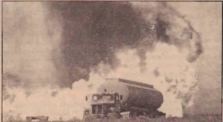
வட ஈராக்கின் கிளூக் நகரில் எண்ணெய் குழாய் வெடித்ததில் சேதமுற்ற ட்ரக் வண்டி. (வெடிப்புக்கான காரணம் அறியப்படவில்லை.)

ஈராக்கில் அமெரிக்கப்படையினர் மீது அண்மைக்காலத்தில் நடத்தப்பட்ட பெரிய தாக்குதலில் ஒன்றென்பது குறிப்பிடத்தக்கது. மேலும் தாக்குதல் நடந்த பகுதியில் அமெரிக்கப் படையினர் சுற்றி வளைப்புத் தேடுதல்களை நடத்திய தாகவும் தெரிவிக்கப்படுகின்றது.