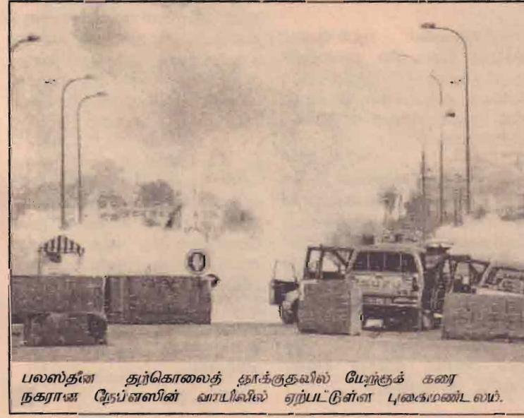
பலஸ்தனை தற்கொலைத் தாக்குதலில் பேரூக்குக் கரை நகராஜ நேப்பேஸின் வாடிகளில் ஏற்பட்டுள்ள புகைமண்டலம்.

இதேவேளை பாகிஸ்தானுக்கு நேட்டோ (வட அட்லாண்டிக் உடன்பாட்டு அமைப்பு) சாராத தோழமை நாடு எனும் அந்தஸ்தினை அமெரிக்கா வழங்கியுள்ளமை குறிப்பிடத்தக்கது. மறுபுறம் பயங்கரவாத ஒழிப்பில் அமெரிக்காவுக்குத் துணை புரிவதன் மூலம் பாகிஸ்தானுக்கு 2001 முதல் 45 ஆயிரம் கோடி செலவாகியுள்ளது என்று அமெரிக்கா கூறியுள்ளது.