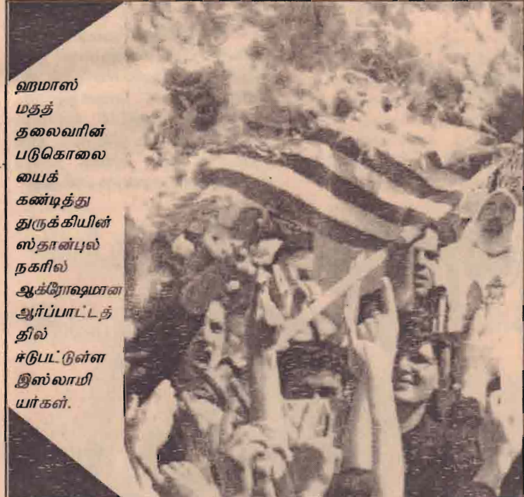
ஹமாஸ் மதத் தலைவரின் படுகொலையைக் கண்டித்து துருக்கியின் ஸ்தான்புல் நகரில் ஆக்ரோஷமான ஆர்ப்பாட்டத்தில் ஈடுபட்டுள்ள இஸ்லாமியர்கள்.

விடயங்கள் ஏற்றுக்கொள்ளப்பட்டுள்ளமை குறிப்பிடத்தக்கது. இதேவேளை ஆப்கானிஸ்தானிலுள்ள ஐக்கியநாடுகள் உதவி வழங்கும் அமைப்பின் நடவடிக்கைகள் 2005 ஆம் ஆண்டு வரை நீடிக்கப்பட்டுள்ளதாக நேற்றுமுன்தினம் பாதுகாப்புச் சபை அறிவித்துள்ளது. அதேவேளை ஆப்கானிஸ்தானில் நிலை கொண்டுள்ள 13 ஆயிரம் அமெரிக்கப்படைக்கு உதவும் வகையில் மேலும் 2000 அமெரிக்கக் கடற்படைவீரர்கள் காபூலுக்கு அனுப்பிவைக்கப்படவுள்ளமை தெரிந்ததே.