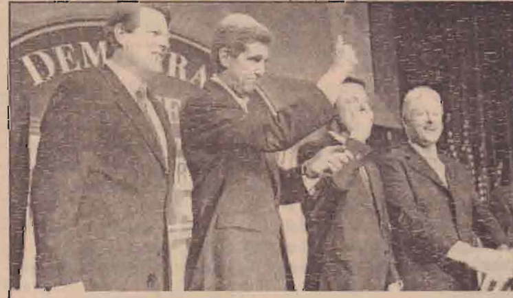
வாஷிங்டனிலுள்ள தேசிய நூதனசாலைக் கட்டிடத்தில் நடைபெற்ற இராப்போசன விருந்தின் போது மக்களுக்கு வாழ்த்துத் தெரிவிக்கும் (இடமிருந்து வலமாக) முன்னாள் உபஅதிபர் அல்கேன், சனநாயகக் கட்சி சனாதிபதி டேட்டாஸ் ஜோன்ஹெரி, ஜோன் எட்வர்ட் முன்னாள் சனாதிபதி பில்கிளிண்டன் ஆகியோர்.