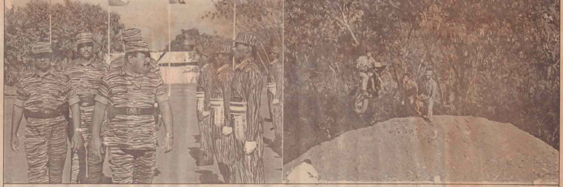
விடுதலைப்புலிகளின் அதிவேக உந்துருளி சிறப்பு அணியை தேசியத்தலைவர் அவர்கள் பார்வையிடுவதையும், அணியின் சாகச நிகழ்வொன்றையும் மேலுள்ள படங்களில் காணலாம்.

நாதம் 16 திருவள்ளூர் ஆண்டு 2035 மாசி -09 21-02-2004 சனிக்கிழமை ஓசை -003