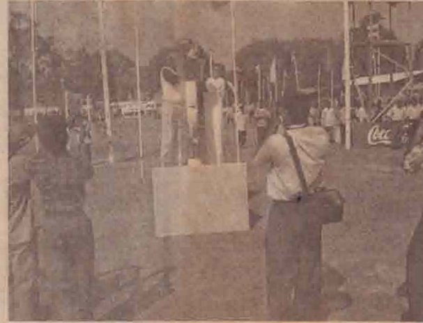
ஒலிம்பிக் தீபத்தினை திரு.எதிர்வீரசிங்கம், ரதிகலா ஏற்றிவைக்கும் காட்சி.