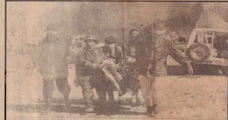
டெஹ்ராடூக்கு 700 கி.மீ.நூற்ற தொலைவிலுள்ள நீஷாபூருக்கு அண்மையில் நடந்த ரயில் விபத்தில் காயப்பட்ட ஒருவரை தூக்கிச் செல்லும் மீட்புப் பணியாளர்கள்.

2005 ஆம் ஆண்டுக்கான எச்-பி விசா பெறுவதற்கான மனுக்கள் வருகின்ற ஏப்ரல் முதலாம் திகதி முதல் பெறப்படும். அதற்கான விசாக்கள் அக்டோபர் முதலாம் திகதி கொடுக்கப்படும் என அவர் மேலும் தெரிவித்துள்ளார்.