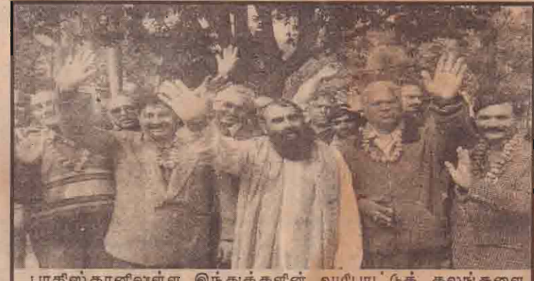
பாசீஸ்தானிலுள்ள இந்துக்களின் வழிபாட்டுத் தலங்களை தாசிசீக்க வந்துள்ள இந்திய யாத்திரிகர்கள் வாகா சோதனை நிலையத்தில் ஊடகவியலாளர்களுக்கு கையசைக்கின்றனர்.