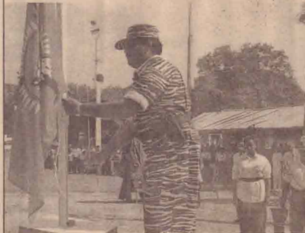
கடற்புலிகளின் சிறப்புத் தளபதி கேணல் குசை அவர்கள் தமிழீழ தேசியக் கொடி ஏற்றி வைக்கையில்.