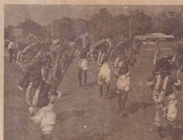
காந்திநிலைய மாணவர்களின் காஷ்ட நடனம்.