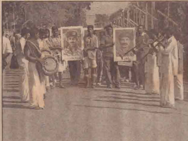
மாணவர்களின் திருவுருவப் படங்களைத் தாங்கியவாறு விளையாட்டு வீரர்கள் பிரதான வீதி வழியாக கிளிநொச்சி பொது விளையாட்டு மைதானத்தினை நோக்கி நகர்கின்றனர்.

அதனைத் தொடர்ந்து, கோப்பாய் ஆசிரிய கலாசாலை மாணவிகளின் அபிநய நிகழ்வு, செஞ்சோலை மாணவிகளின் அபிநய நிகழ்வு மற்றும் யாழ்.பல்கலைக்கழக மாணவர்கள், கடற்புலிப் போராளிகள், யாழ்.மாவட்ட ஜிம்னாஸ்டிக் கழக மாணவர்கள் இணைந்து வழங்கிய ஜிம்னாஸ்டிக் நிகழ்வு என்பன இடம்பெற்றன. (சே)