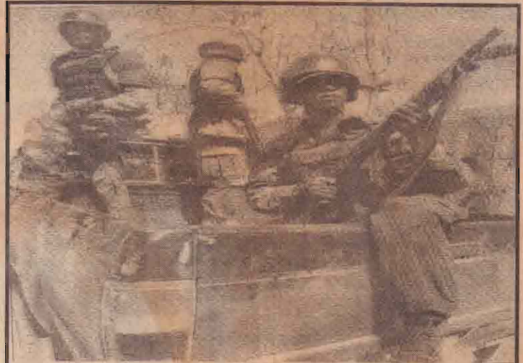
கைப்பற்றப்பட்ட நகரில் ரோம்து கூற்றும் தீவிரவாதிகள்.

சமரசப் பேச்சாளர்கள் நாளை கெய்ட்டி செல்வர்கள் என்றும் உடனடியாக சனாதிபதியைச் சந்திப்பார்கள் என்றும் இத்தகைய நிலைமை தொடர்ந்தும் நீடிக்க அனுமதிக்கக் கூடாது என்றும் கனடிய வெளிவிவகார அமைச்சர் கேட்டுக்கொண்டுள்ளார்.