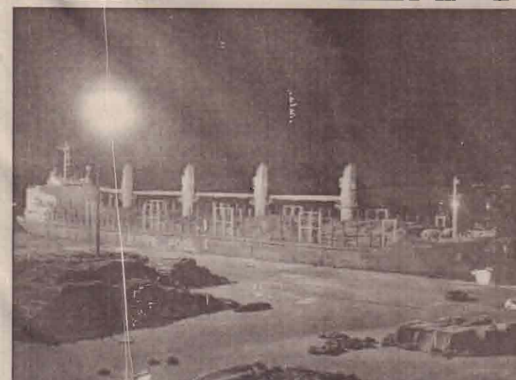
தென்கொரியாவின் மேற்குக்கரை குசன் துறைமுகத்திற்கு ஓசாமாபின்லெடனின் ஆல்ஹைதா உறுப்பினர்களை ஏற்றிவந்ததாக சந்தேகிக்கப்பட்ட அத்தெனாடொகூஸ் எனப்படும் சுப்பல். இதில் மரத்துளையான சீர்திருத்தம் எனப்படும் குறிப்பிடத்தக்கது.