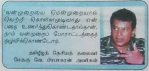
'வன்முறையை ஏமன்முறையால் வெற்றி கொள்ளமுடியாது என்பதை உணர்த்துகொண்டதால்தான், நாம் வன்முறைப் போராட்டத்தைத் தழுவிக்கொண்டோம்.