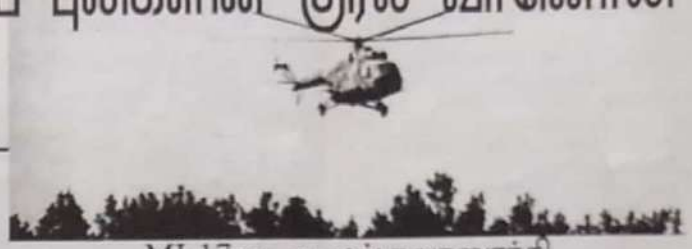
MI-17 ரக உலங்குவானூர்தி

சிறிலங்கா அரசினரும் முப்படைகளினதும் இடையேயான சிறிலங்கா வான்ப்படையின் பிரதான மையத் தளத்திலுள்ள இன்று அதிகாலை முதல் முற்பகல் வரை விடுதலைப் புலிகள் மேற்கொண்ட துணிசூர ஊடுருவல் தாக்குதலில் சிறிலங்கா வான்ப்படையின் 8 வான்ணர்திகளும் 3 போக்குவரத்து வான் ஊர்திகளும் முற்றாக தகர்க்கப்பட்டன என 3 போக்குவரத்து வான்ணர்திகள் கருமையான சேதம் அடைந்துள்ளன. செய்தி ஊடகங்கள் தரும் தரவுகளின்படி விடுதலைப் புலிகளின் அணி ஒன்று ஊடுருவல் நடவடிக்கை ஒன்றை மேற்கொண்டு உச்ச பாதுகாப்புக் கொண்ட கட்டுநாயக்க விமானப்படைத்தளத்தில் யுணமுத்து அங்கு இன்று அதிகாலை 3.25 மணி அளவில் தாக்குதலை தீவிரமாக ஆரம்பித்தனர். விமானப்படையின் அறிவுப் தாக்குதல் வலுவாக வான்ணர்திகளின் தரிப்பிடத்தின் மீது முதலில் தாக்குதலை விடுதலைப் புலிகள் நடத்தினர். இன்று காலை 7.30 க்குள் தரிப்பிடத்தில் நின்ற 8 வான்ணர்திகள் தாக்கப்பட்டு எரிபூட்டப்பட்டன. இதில் 8 வான்ணர்திகளும் தகர்ந்துபோயின. அத்துடன் ஏரிப்பொருள் தாங்கியும் எரிபூட்டப்பட்டன. மிக 279 க் மிகையொளி வேகத் தாக்குதல் விமானம் ஒன்று, கீ.பி மிகையொளி வேகத் தாக்குதல் விமானங்கள் இரண்டு, MI-24 ரக தாக்குதல் வான்ணர்தி ஒன்று, MI-17 ரக படைக்காணி வான்ணர்தி ஒன்று, A 8 பயிற்சி விமானங்கள் மூன்று என்பன அழிக்கப் பட்டனவென்றது.