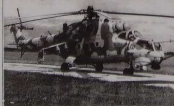
MI-24 ரக உலங்குவானூர்தி

1993ம் ஆண்டு கொள்வனவு செய்யப் பட்ட சர்வியத் தயலிபான MI-17 வானூர்திகள் சிறிலங்கா படைகளுக்கு திராணுபடுத்தினதற்கு காரணம் போர் முனைச் செயல்படுகளுக்கு பிரதான ஆதர்புலமாக உள்ளன.