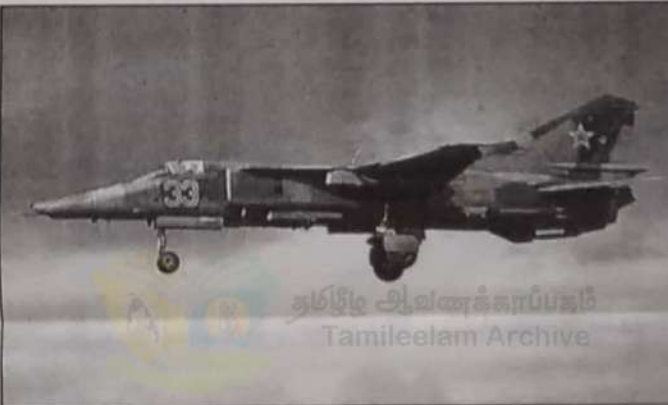
MIG-27 ரக போர்விமானம்

எங்கும் வான்ப்படையினங்கள் அழிக்கப்பட்டதை இனிப்பொருட்களை பரிமாற்றி தமது மகிழ்ச்சியை பகிர்ந்துகொண்டனர். குறிப்பாக வன்விப்புகுறி எங்கும் மக்கள் மகிழ்ச்சி ஆரவாரம் செய்தவண்ணம் உள்ளனர். இனிப்பொருட்கள் பரிமாறுவதை எங்கும் பார்க்கும் வன்வணக்க உள்ளது. சிறிலங்காவின் வான்ணர்திகள் தமிழகக் கீழ் பறிந்துள்ள அட்டுபிளக்கள் நினைவுட்டத்தக்கதாகும். தயாலித் தேவலாபத்தில் சில நிமிட நேரத்தில் 122 அடாய்மீக் களை பரி கொண்டனம், தாக்கோவில் பட்டாளலையில் 30க்கும் அதிகமான மாணவர்களை பரி கொண்டனம், பாப்பா ஆலயத்தில் 10க்கும் அதிகமான அடாய்மீக் களை பரி கொண்டனம், வலங்குள தேவாலய படுகொலை, அரியலா நாலையு கிராம படுகொலை, சாயக்சேரி நகரம் மற்றும் சங்கத்தானை படுகொலை, பந்துவில் படுகொலை, தாச்சிபுடா படுகொலை, கத்திரபுரம் படுகொலை உட்பட பல ஆயிரம் தமிழகத்தை சிறிலங்கா வான் படை வான்ணர்திகள் குன்றுகளை விசி கொன்றுமுடிந்தது குறிப்பிடத்தக்கது.